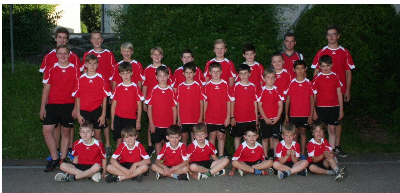
Jugi Bichelsee 2020