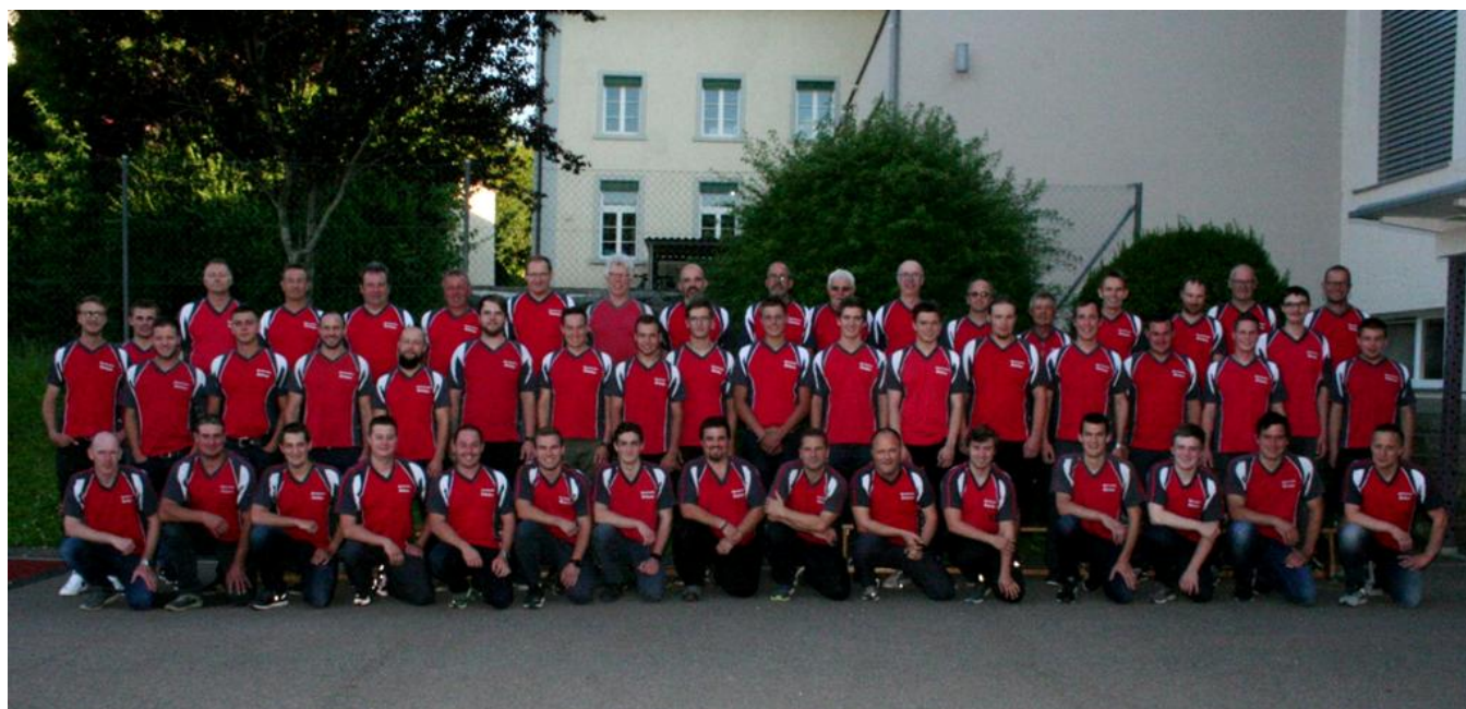
TSV Bichelsee 2020